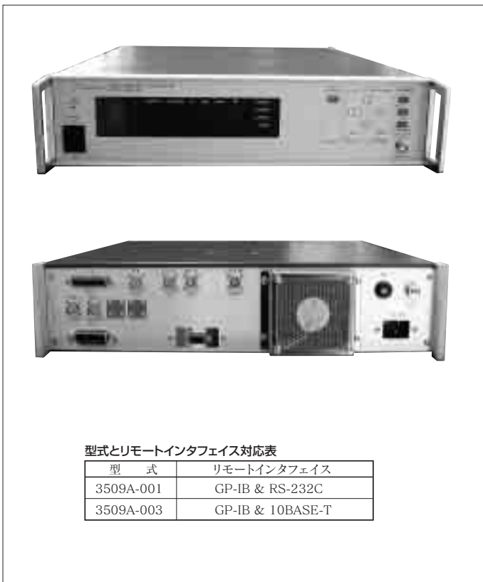
型式とリモートインタフェース対応表